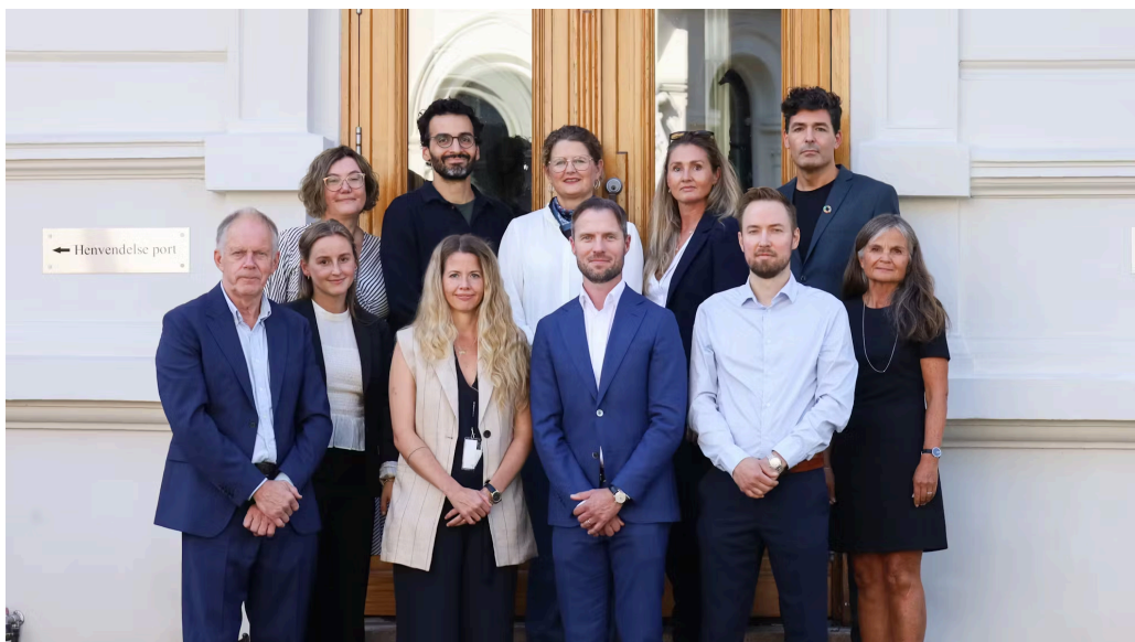
Medlemmene av Partnerdrapskommisjonen sammen med sekretariatet ved oppnevning

SRF deltar i den tverrsektorielle direktoratsgruppen om vold i nære relasjoner og vold og overgrep mot barn. SRFs deltakelse inkluderer en medarbeider fra sekretariatet. Direktoratsgruppen bidrar til økt innsikt i utfordringsbildet som er av betydning for kommisjonens arbeid og er en egnet arena for kunnskapsutveksling på området.