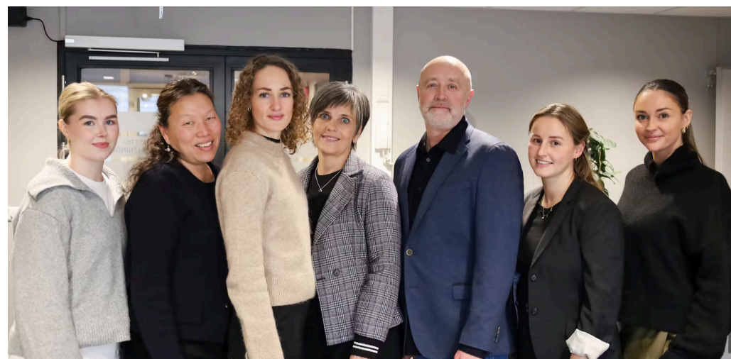
Lederne av Tilsynsrådet for kriminalomsorgen sammen med sekretariatet i SRF.

Sekretariatet er samlokalisert med Kontoret for voldsoffererstatning i Vardø. SRF gjennomførte en rekrutteringsprosess til sekretariatet i 2024. Dette resulterte i én ny fast medarbeider i sekretariatet. I tillegg består sekretariatet av tre erfarne medarbeidere i SRF som etter en intern mobilisering, vil arbeide i Vardø i inntil ett år. Ved utgangen av 2024 pågår en ny rekrutteringsrunde med sikte på å fylle flere faste stillinger i sekretariatet for Tilsynsrådet.