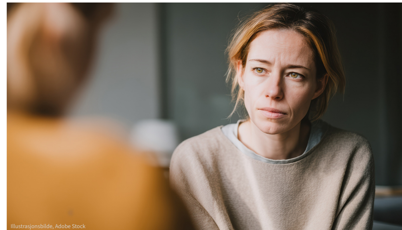
Illustrasjonsbilde, Adobe Stock

Hyppige tilsyn vil kunne forebygge selve selvdrapet, men slik Tilsynsrådet ser det vil ikke regelmessige tilsyn være tilstrekkelig for å redusere den innsattes ønske om å ta sitt eget liv. Til det vil andre tiltak kunne være viktigere. Tilsynsrådet anbefaler derfor at kriminalomsorgen vurderer andre tiltak enn tilsyn for å forebygge selvdrapfare. Vi savner også en større involvering av helsepersonell og deres med-