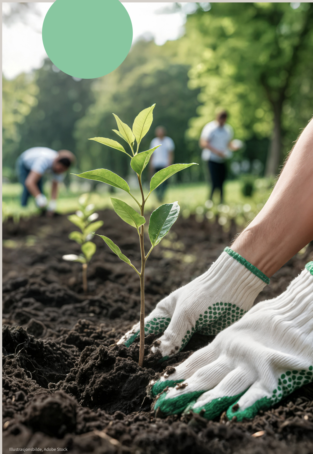
Illustrasjonsbilde, Adobe Stock